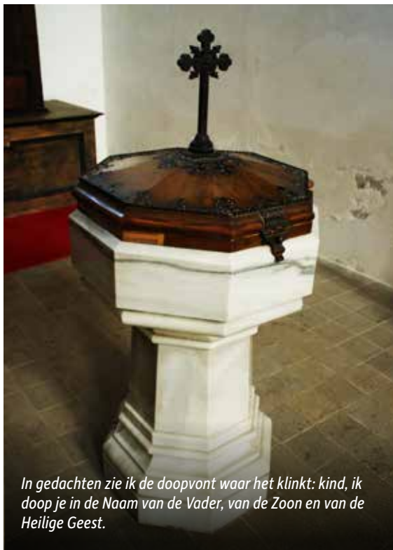
In gedachten zie ik de doopvont waar het klinkt: kind, ik doop je in de Naam van de Vader, van de Zoon en van de Heilige Geest.

Als ik mijn ogen dicht doe, is het zondag en ben ik in de kerk. Ik zie de gemeente om mij heen. Kinderen en jongeren, volwassenen en bejaarden. Ik zie de gemeente van Christus, geroepen uit de duisternis tot het wonderbaar Licht. Wat mis ik haar. Ik zie in gedachten de preekstoel, de plaats waar de dienaar